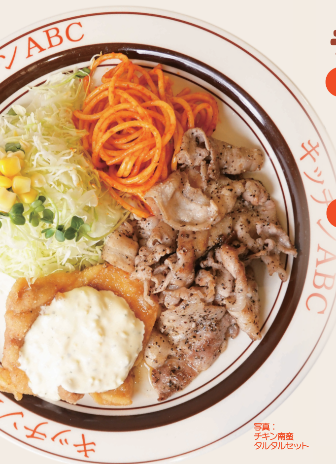
写真：チキン南蛮タルタルセット