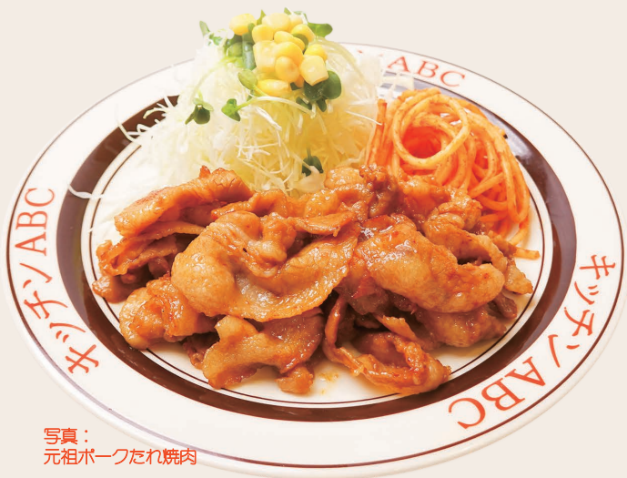
写真： 元祖ポークたれ焼肉