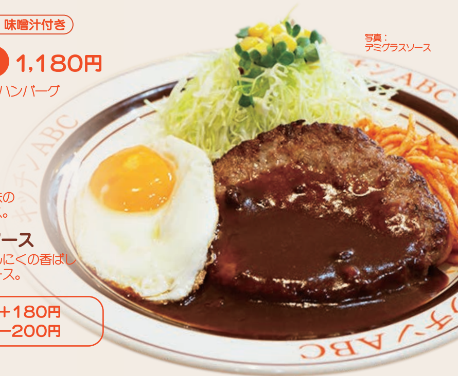
写真：デミグラスソース

ライス大盛り . . . . . +180円 単品（ライス・味噌汁なし）-200円