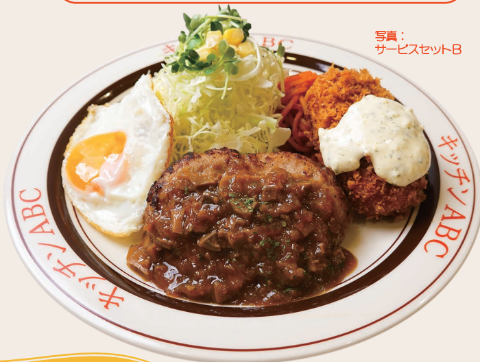
写真: サービスセットB